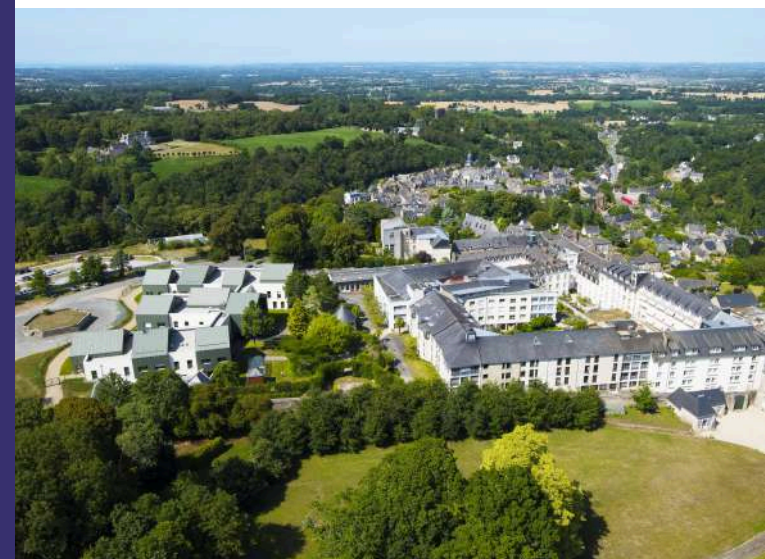
Établissement de Tinténiac - Hospitalité Saint-Thomas de Villeneuve

Des représentants des usagers à votre écoute